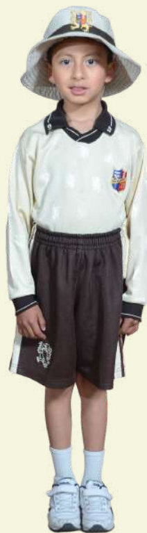
Uniforme de Educación Física